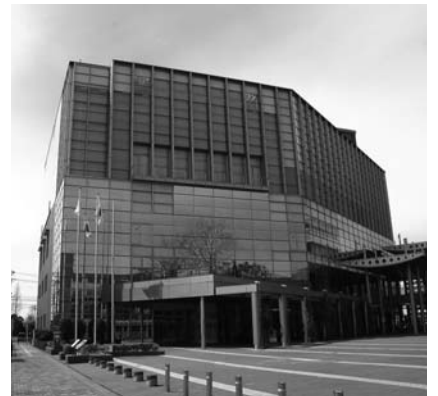
シビックセンター

「配信動画製作委託料の内容について伺う」との質疑があり「市ホームページから配信する動画製作のための委託料であり、従来のケーブルテレビだけでなく、市ホームページからインターネットによって動画配信することで、市内外を問わず多くの人が視聴可能となる。本市の歴史遺産、イベントの配信は、市外からの観光客誘致活動の一助になり、また市民向けにごみ分別方法などの情報を動画で説明すれば市民生活の向上にもつながるものと考えているが、市外・県外へPRする家康行列や観光夏まつりといったものは、肖像権などの関係があることから、その対応を踏まえ業者へ製作委託するものである」と答えた。 「指定管理者制度導入施設において、市民サービス向上に期待できる新たな企画があれば伺う」との質疑があり「新たなサービスとして、平成23年度に10周年を迎えるシビックセンターで会員制度を導入する。この制度は有料と無料の2種類あり、無料会員からは情報誌の送付とチケットの先行予約を受け付ける。有料会員からは、年会費5000円で情報誌の送付