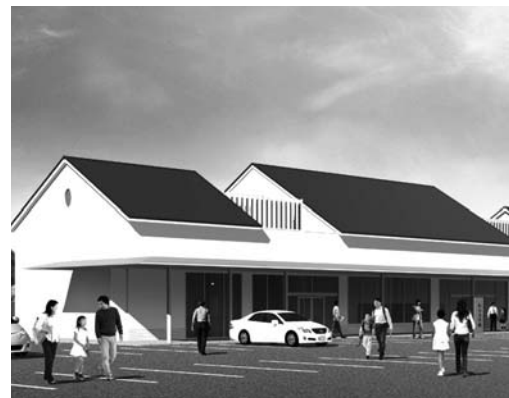
道の駅地域振興施設（イメージ図）

質疑 道の駅を市の東の玄関口として観光における情報発信拠点として生かす取り組みと、この施設の名称にもなっている旧東海道藤川宿方面への利用者の誘導について伺う。また、産直施設を設置する計画になっているが、特徴は。