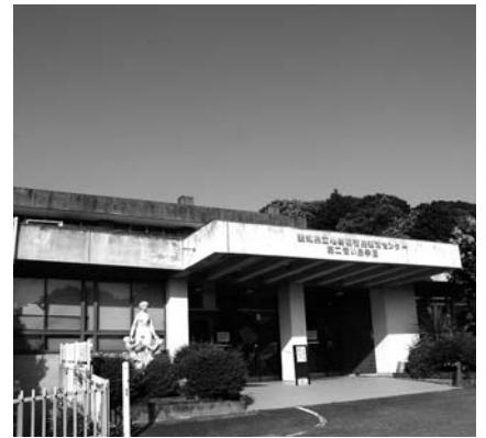
県立第二青い鳥学園

鳥学園は、昭和38年に建設され老朽化が著しい。県が施設移転を検討していると聞くと、現状は。