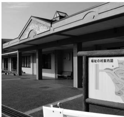
福祉の村（にじの家）

答 現在の進捗状況について、福祉の村に隣接する用地を23年度中に取得することを計画している。また、（仮称）こども発達センターの核となる医療部門については、優秀な医療スタッフ等を確保し、安定的な経営による診療を行う必要があり、必要な検査などへの迅速な対応の観点からも、市民病院医局を通じた医師の確保や病院各局との一体的な医療スタッフの配置が最良の方法と考えている。