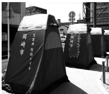
下水道災害対応トイレ

た、形埜地区を始め額田地区における飲料水の確保については、避難が想定される人数分に対して必要な数量をペットボトルで対応したいと考えている。