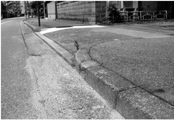
マウントアップ型歩道

して計画している。ただ、無症状のがんの発見やがんと診断された後の転移・再発の発見、がん治療の効果の判定などPET/CTの必要性は十分認識しており、今後導入に向けた準備を進めたい。