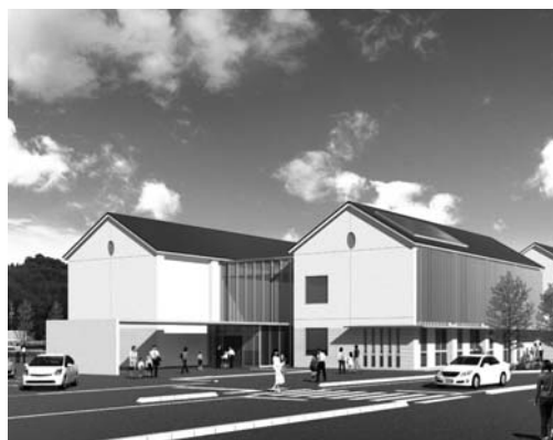
東部地域交流センター(イメージ図)

公明党 は、「同施設は東西に動線が長く、特徴の一つである大きなプレイルームが受付カウンター、事務所から死角の位置になる。不特定多数の人が利用するだけに、危機管理には十分な配慮を要望する」と意見を述べ、賛成した。