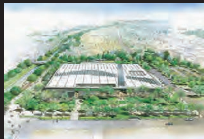
図書館交流プラザ・りぶら ビスタラインなどの歴史的文脈・都市景観と融合した建築デザイン