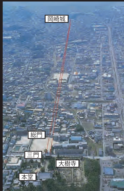
大樹寺上空より岡崎城方面を望む